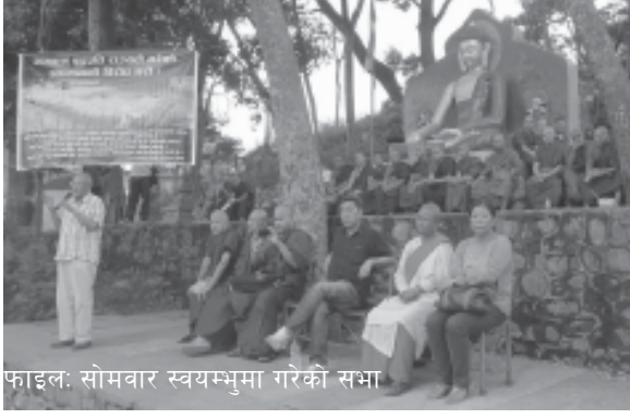
फाइल: सोमवार स्वयम्भुमा गरेको सभा

सुर्खेतको कांक्रेविहारमा बुद्धको प्रतिमा स्थापना गर्न पाउनुपर्ने माग गर्दै आन्दोलनरत सरोकार समितिले साउन ९ गते बुधवार कीर्तिपुरमा सभा गर्ने भएको छ।